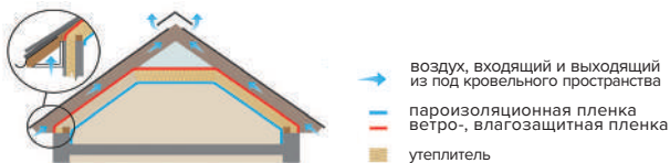
Рис. 1. Устройство вентиляции мансарды

он при помощи бруска, прикрепленного к стропильной ноге. Зазор составляет 50–100 мм, зависит от угла наклона кровли и длины ската. Для хорошей циркуляции воздуха в зазоре должны быть предусмотрены входные и выходные вентиляционные отверстия, площадь сечения которых зависит от длины ската и площади кровли. В среднем зазор для притока создается не менее 3 см шириной на всю длину ската.