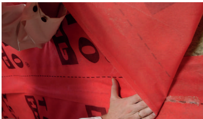
Рис. 6. Проклейка стыков пароизоляционной пленки