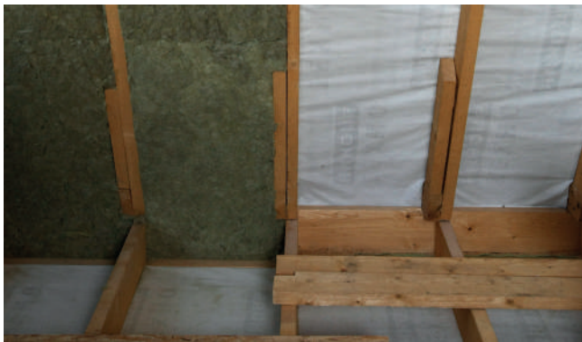
Рис. 2. Подготовленная система для дальнейшего монтажа теплоизоляции