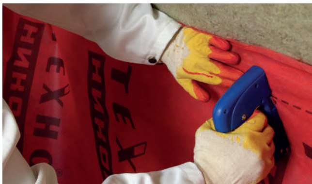
Рис. 5. Укладка и фиксация пароизоляционной пленки