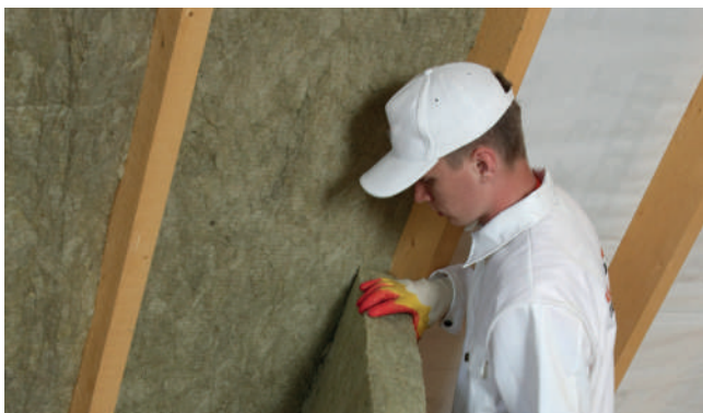
Рис. 3. Монтаж теплоизоляции враспор между стропилами