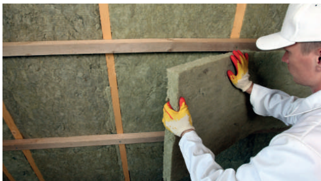
Рис. 4. Укладка второго слоя теплоизоляции